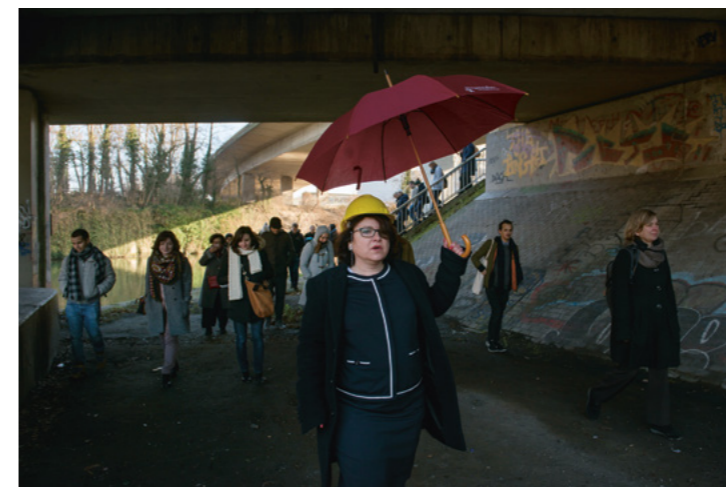
Walhalla tours voor Against the Grain, foto: Moniek Wegdam