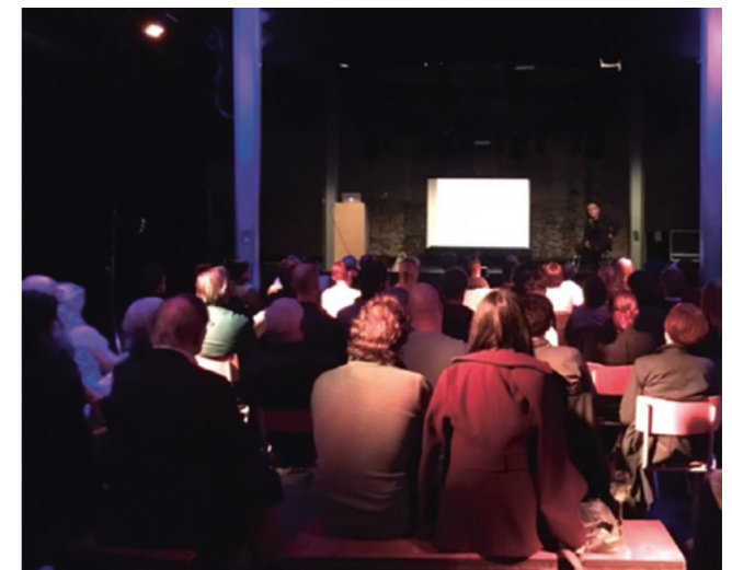
Wiel Arets - Bas Prinsen