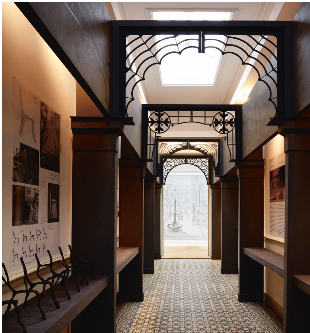
Design by Choice