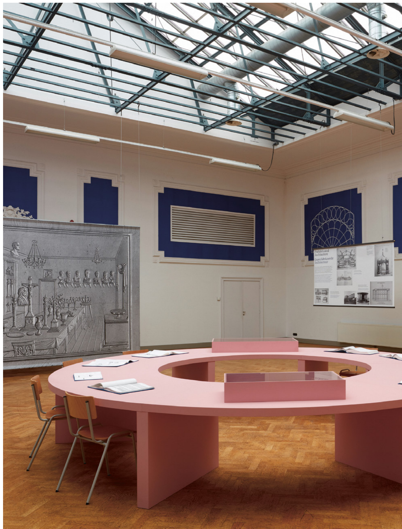
Design by Choice, foto: Johannes Schwartz