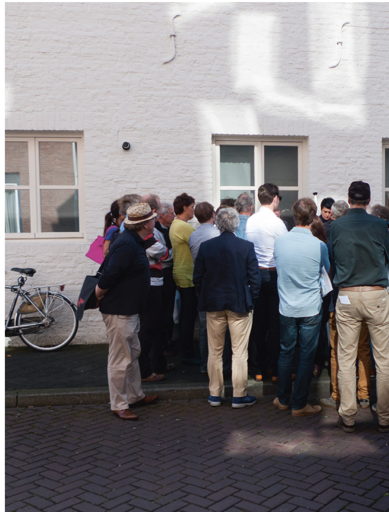
Helden van Hier stadswandeling Jo Coenen