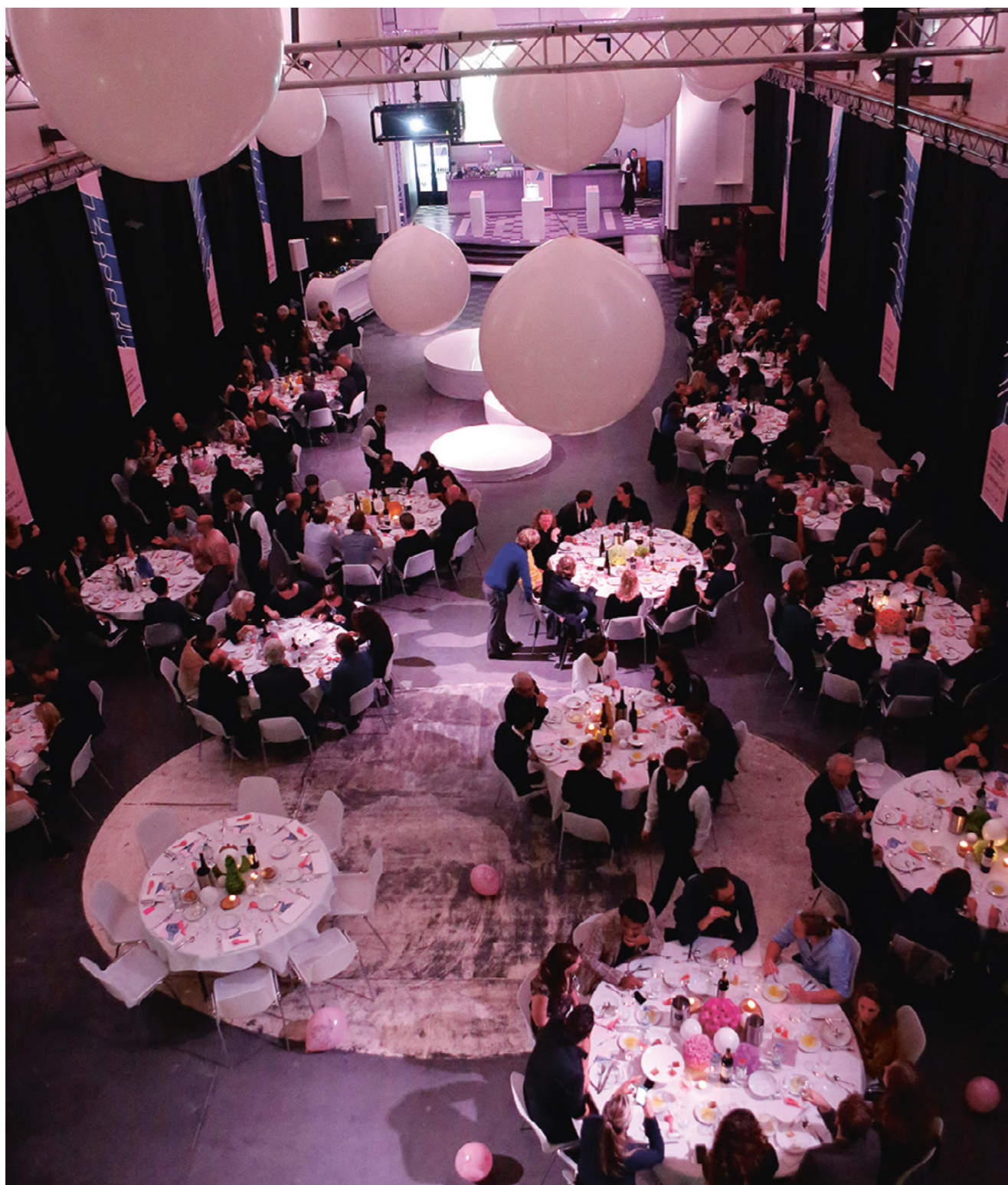
The Great Indoors

The Great Indoors Award is een internationale, tweejaarlijkse prijsvraag op het gebied van interieurvormgeving. Het is een initiatief van Marres, huis voor contemporaine cultuur, FRAME magazine en Bureau Europa.