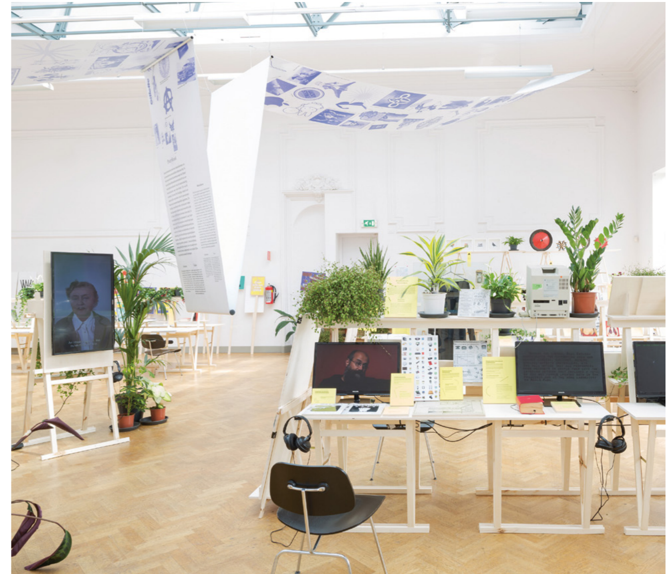
Werkplaats voor de Nieuwe Wereld, foto: Dennis Guzzo