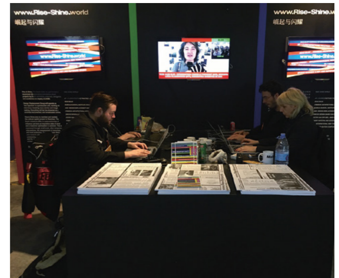
Rise and Shine