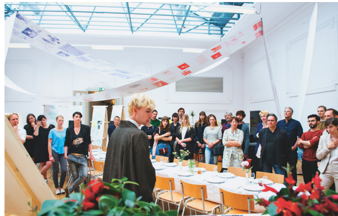
Meet the Maker