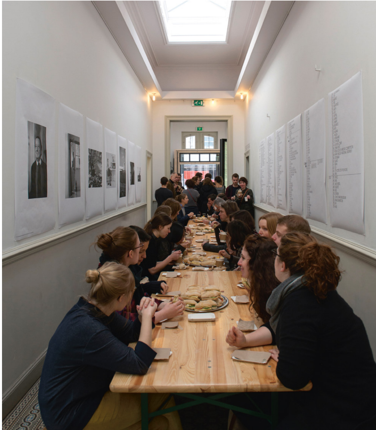
Lunch Against the Grain

Against the grain was een symposium over de narratieve kenmerken van de architectuur. Tijdens het symposium werd de oorsprong van de term 'narratief' aan de orde gesteld om tot kennisproductie te komen, waarbij variatie en interdisciplinaire opvattingen over ervaring, associatie en het ergens toebehoren werden omarmt. Ook werd onderzocht hoe het op dit moment staat met de curricula van het architectuuronderwijs in Aken, Delft, Eindhoven, Luik, Hasselt en Londen.