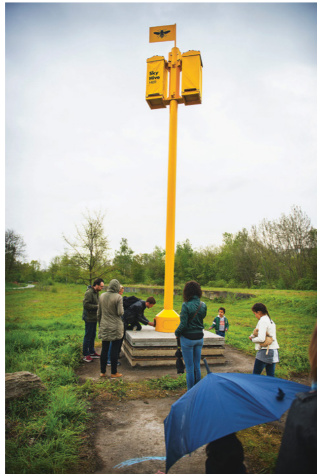
Opening Sky Hive