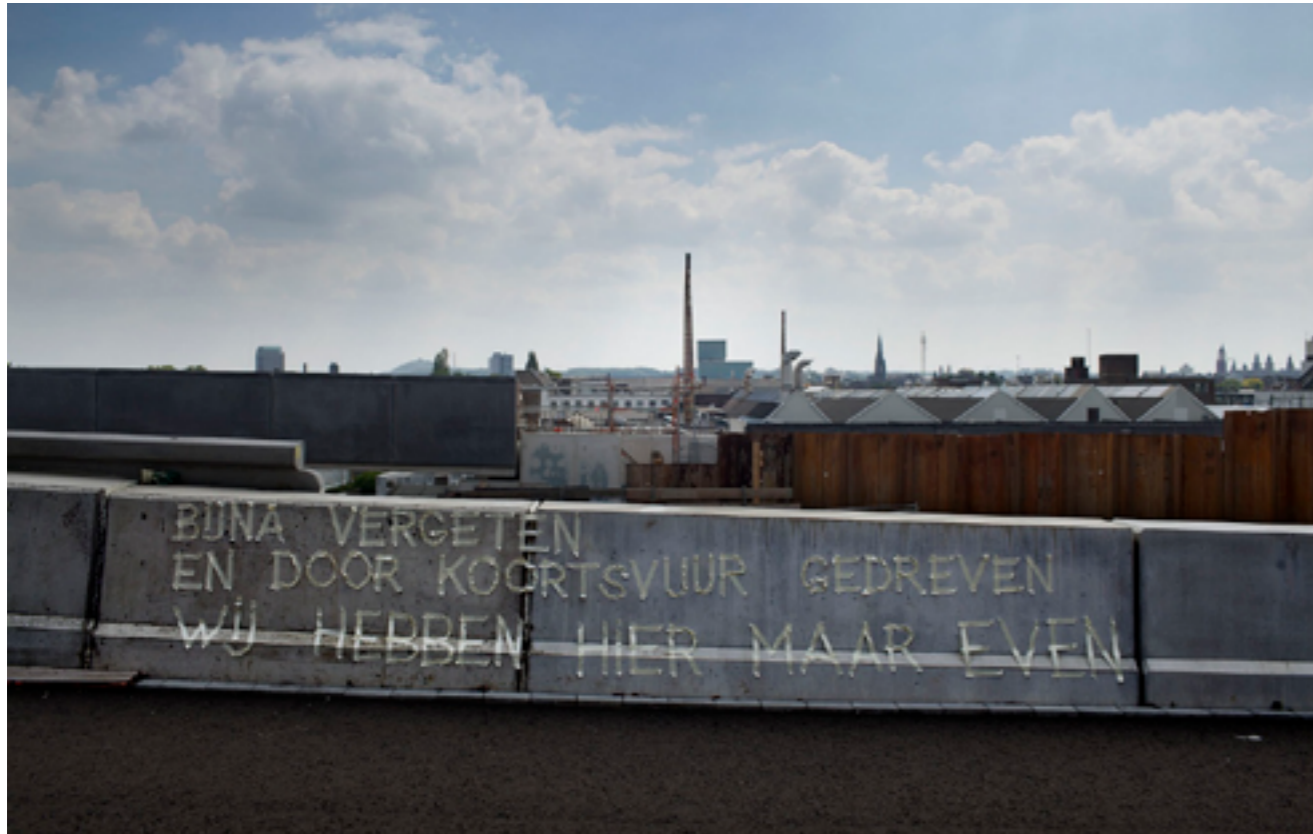
Het Scherp van de Stroper

Van 24 januari tot 28 februari was Het Scherp van de Stroper bij Bureau Europa te zien, een autonoom project van dichter Maarten van den Berg en fotograaf Bert Janssen over hun verhouding met een transformerend Maastricht.