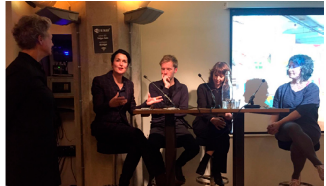
China Creates — Lezing Pakhuis De Zwijger

Terugblik van de Nederlandse deelnemers op de bi-biënnale van Shenzhen Hong Kong. De Biënnale bood voorbeelden en visies afkomstig uit de hele wereld voor de Pearl River Delta; ze toonden hoe de stad opnieuw kan worden voorgesteld, gepresenteerd, hergebruikt en opnieuw tot leven kan worden gebracht. In deze editie van China Creates werden de Nederlandse deelnemers gevraagd om hun ervaringen en ideeën te delen.