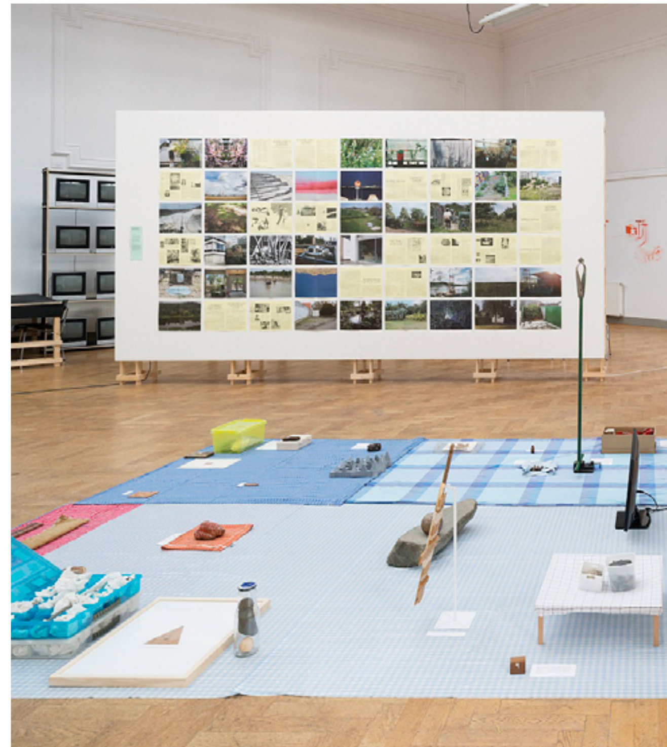
Bronsgroen Eikenhout