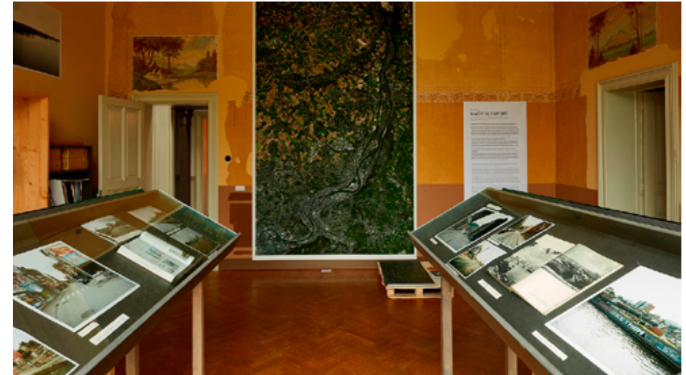
Made In Europe

Op uitnodiging van Bureau Europa onderzocht beeldend kunstenaar en fotograaf Kim Bouvy (1974) de specifieke wederkerigheid tussen de industriële geschiedenis en identiteit van Luik en Maastricht, twee steden die van groot belang zijn voor de voetnoten van de Europese geschiedenis.