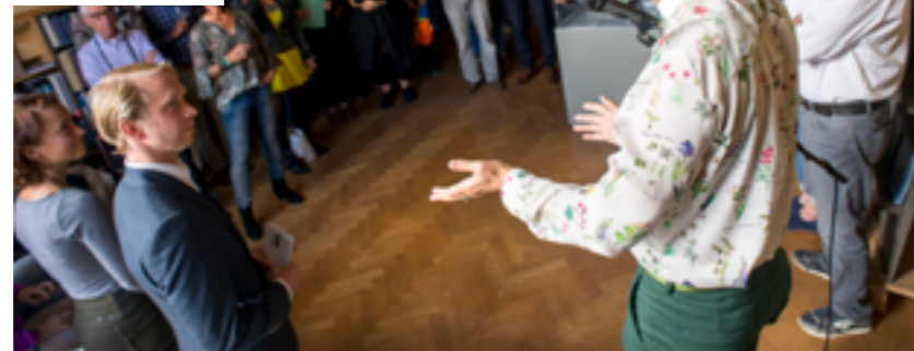
Bronsgroen Eikenhout