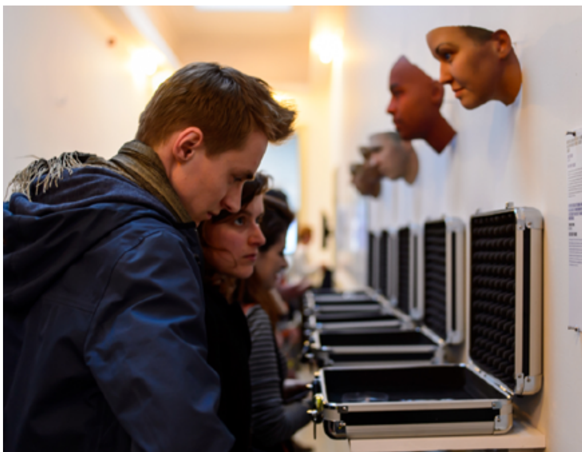
The Next Big Thing is Not a Thing.