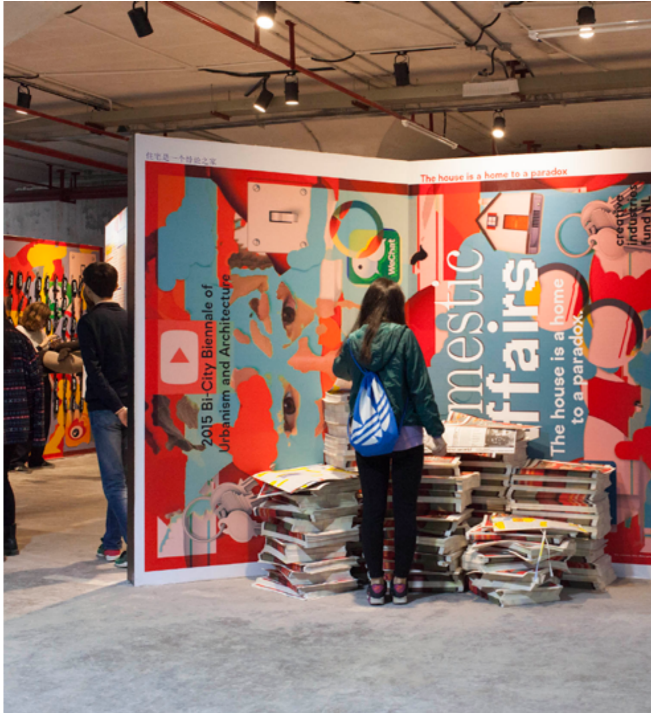
Domestic Affairs

Na een succesvolle eerste editie in januari bij de Passagen in Keulen - het grootste designevenement van Duitsland - werd voor een tweede editie van Domestic Affairs , de inhoud van de tentoonstelling vertaald naar een Chinese context.