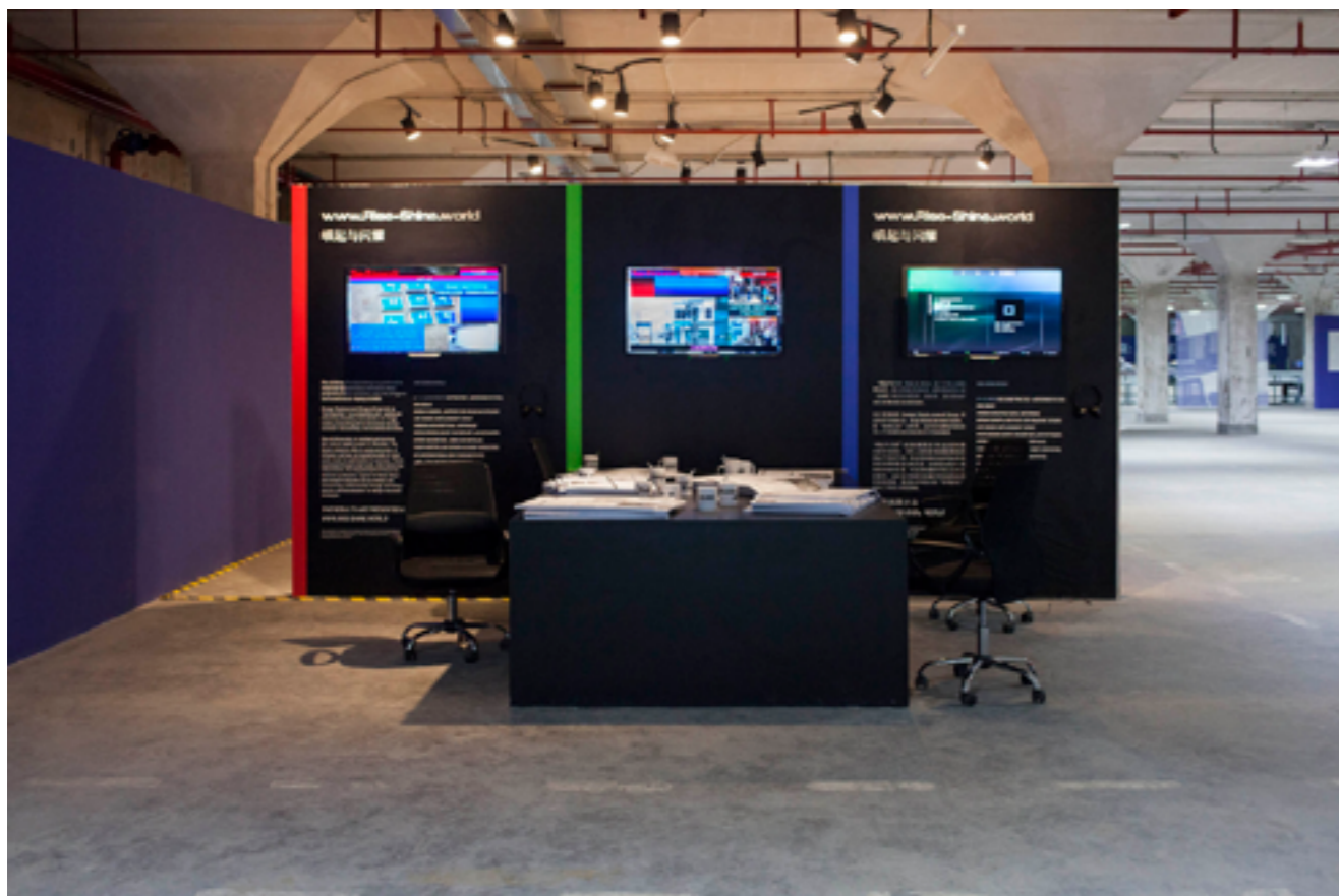
Rise &amp; Shine

4 december 2015 – 28 februari 2016 (doorlopend online)