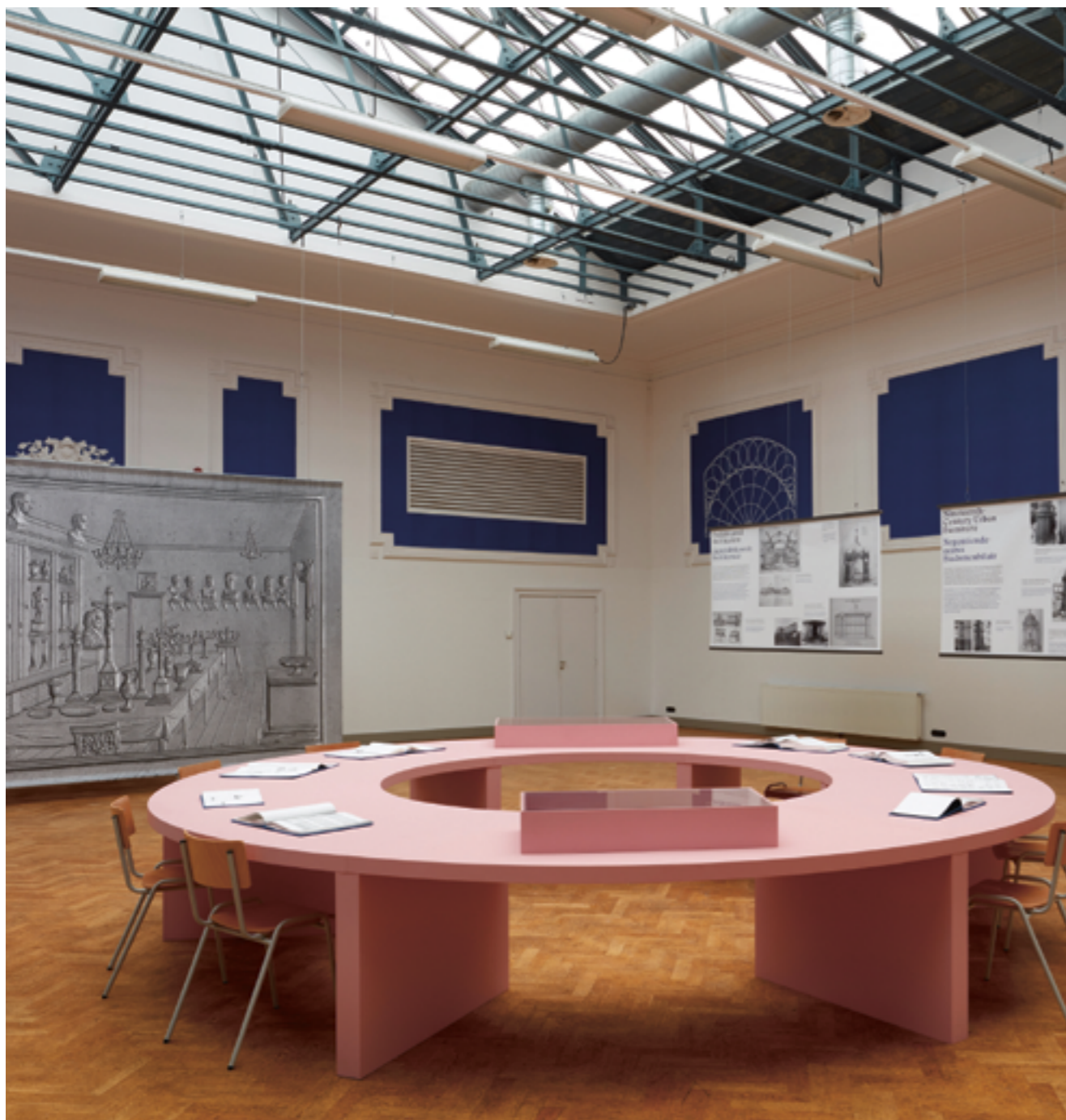
Domestic Affairs

Met de tentoonstelling Design by Choice onderzocht Bureau Europa de oorsprong van de hedendaagse consumptiemaatschappij door terug te grijpen op de productie van gietijzer.