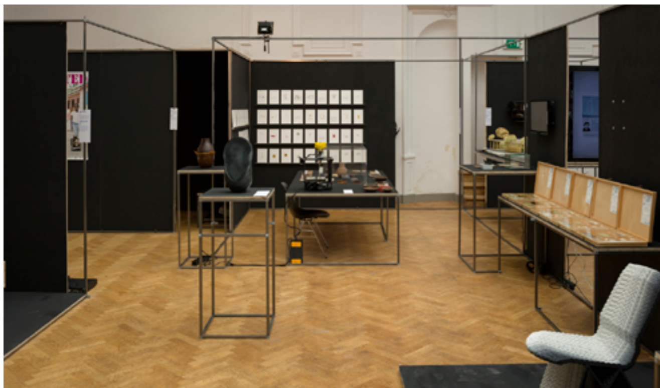
The Next Big Thing is Not a Thing

In de tentoonstelling The Next Big Thing is Not a Thing verbond Bureau Europa de laatste ontwikkelingen op het gebied van design met de wetenschap van de antropologie. Met 'de blik' als metafoor verkende de tentoonstelling de grenzen van de ontwerpdiscipline, en werden nieuwe vormen van kennisontwikkeling en kritische reflectie onderzocht. De tentoonstelling stelde verschillende mythes binnen de vormgeving aan de orde en toonde de invloed van technologie op het designlandschap.