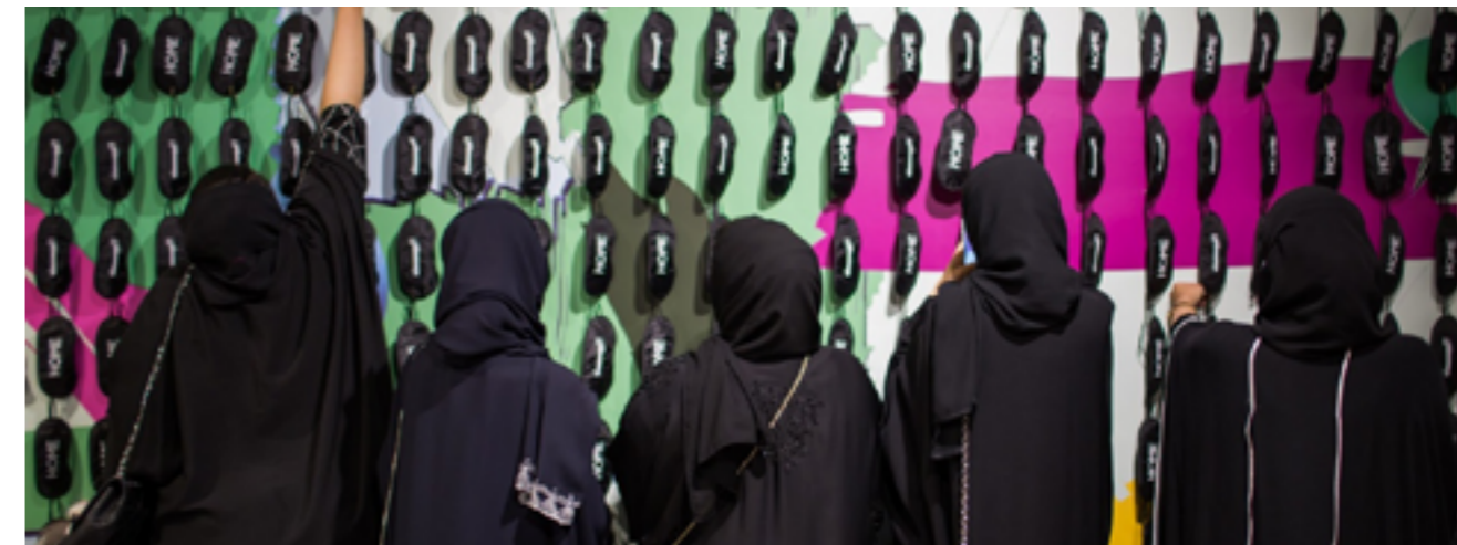
Domestic Affairs Doha

Na twee succesvolle eerdere edities in Keulen (D) en Shenzhen (Ch) was de tentoonstelling Domestic Affairs , a house is a home to a paradox, vanaf 24 Maart te zien in Doha, de hoofdstad van Qatar.