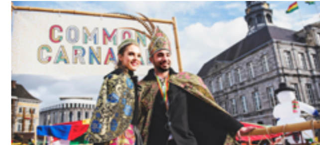
Common Carnaval